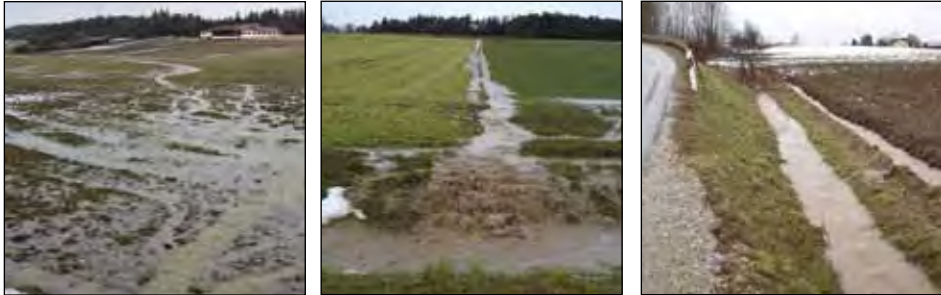
Bildreihe 3: Austragspfade aus der Landschaft: Abflussmulden, Ackerfurchen, Straßen- und Wegseitengräben

Das Ziel einer umfassenden Sanierung dieser verschiedenen Stoffaustrags- und Stoffumlagerungspfade führt letztendlich zur Strategie einer flächendeckend nachhaltigen Nutzung der Landschaft. Im Rahmen des Modellprojekts wurde deshalb eine landschaftsplanerische Methode entwickelt, mit der pragmatisch, aber dennoch umfassend ein fachlich fundiertes Rahmenkonzept zum Thema Stoff- und Wasserhaushaltsmanagement erarbeitet werden kann und das die wesentlichen Problemzusammenhänge, Lösungsansätze sowie kommunalen und überkommunalen Umsetzungsstrategien darstellt.