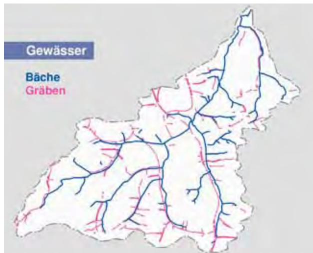
Bild 4: Hinsichtlich ihrer Auswirkungen auf Wasserabfluss und Stofftransport wurden die Wegseiten- und Straßengräben bisher unterschätzt. Das Netz der Wegseiten- und Straßengräben stellt ein zweites Abflusssystem dar, das in seiner Gesamtlänge durchaus das natürliche Gewässersystem übertreffen kann. Es erschließt fein verästelt die Landschaft und trägt wesentlich zur Erhöhung von Abflussspitzen und v. a. zu Stoffausträgen bei. Im Bild das Verhältnis von Bächen und Gräben im Einzugsgebiet des Schwimmbachs.

Das Ziel einer umfassenden Sanierung dieser verschiedenen Stoffaustrags- und Stoffumlagerungspfade führt letztendlich zur Strategie einer flächendeckend nachhaltigen Nutzung der Landschaft. Im Rahmen des Modellprojekts wurde deshalb eine landschaftsplanerische Methode entwickelt, mit der pragmatisch, aber dennoch umfassend ein fachlich fundiertes Rahmenkonzept zum Thema Stoff- und Wasserhaushaltsmanagement erarbeitet werden kann und das die wesentlichen Problemzusammenhänge, Lösungsansätze sowie kommunalen und überkommunalen Umsetzungsstrategien darstellt.