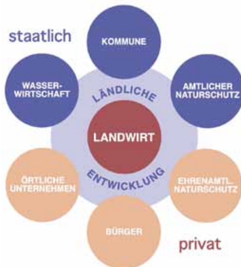
Bild 8: Überblick über die wichtigsten Umsetzungspartner bei der Sanierung des Landschaftshaushalts

Die Mehrheit der Landwirte favorisierte im Modellprojekt grundsätzlich eine eigenverantwortliche Trägerschaft für wasser- und stoffhaushaltliche Maßnahmen. Die Durchführung bzw. Herstellung erfolgt in Eigeninitiative der Landwirte. Es eignen sich vor allem Maßnahmen, wie z. B. Mulchsaat, Anlage von Pufferstreifen an Gräben, Anlage kleinerer Sedimentationsbecken oder Abflussmulden. Zahlreiche Maßnahmen im Rahmen der Flächenbewirtschaftung sind über Agrarumweltprogramme förderfähig. Über diese Programme hinaus lassen die ökonomischen Rahmenbedingungen derzeit jedoch kaum Spielräume für Eigeninitiativen. Evtl. ergeben sich künftig neue Finanzierungsperspektiven durch die Vermarktung von Grünland- bzw. Feuchtgebietesaufwuchs (z. B. Rohrkolben, Kurzumtriebsplantagen) für energetische Zwecke.