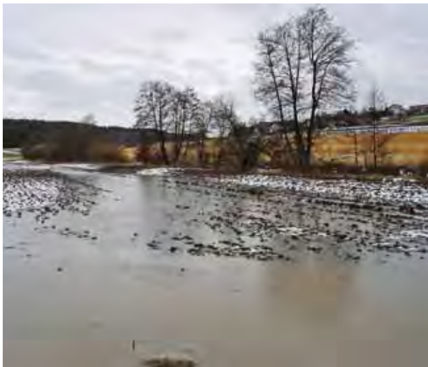
Bild 1: Bundesweit betrachtet stellen die stofflichen Be- lastungen der Gewässer aus landwirtschaftlich genutzten Flächen die zweithäufigste Ursache für das Verfehlen der Ziele der Wasserrahmenrichtlinie dar (BATHE & KLAUER 2009)

Erosion, Hochwasser, Sediment- und Nährstoffeinträge in die Fließgewässer – intensiv agrarisch genutzte Landschaften haben im Hinblick auf ihren Stoff- und Wasserhaushalt mit vielen Problemen zu kämpfen. Worin liegen hierfür die Ursachen? – Kurz gesagt wurden unsere Landschaften im Lauf der Jahrhunderte, insbesondere aber im vergangenen, hinsichtlich ihres Wasserhaushalts auf maximalen Abfluss gestellt: Bäche wurden begradigt, Feuchtflächen drainiert, Abfluss bremsende und Wasser speichernde Strukturen entfernt. Jeder Tropfen Regenwasser wird so schnell wie möglich dem nächsten Vorfluter zugeleitet. Die Folgen sind