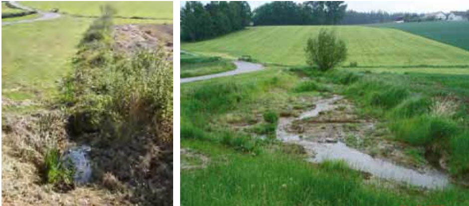
Bildreihe 9: Den Wasserabfluss und Stoffaustrag bremsen: Aus einem Graben wurde eine Feuchtfäche mit vielfältigen physikalischen und bio-chemischen Prozessen

Für die großflächigeren und kostenaufwendigeren Maßnahmen war die Verwaltung für Ländliche Entwicklung mittels Flurneuordnungsverfahren der entscheidende Umsetzungspartner. Der Grunderwerb und die Umsetzung der Maßnahmen erfolgten über die Teilnehmergemeinschaft.