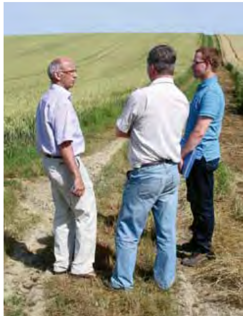
Bild 6: Hilfreich für das gegenseitige Problemverständnis sind gemeinsame Flurbegehungen

Im Schwimmbachgebiet wurden bereits vor Beginn der ersten landschaftsökologischen Erhebungen vor Ort Informationsveranstaltungen mit den Landwirten angesetzt. Darauf folgten einzelbetriebliche Gespräche,